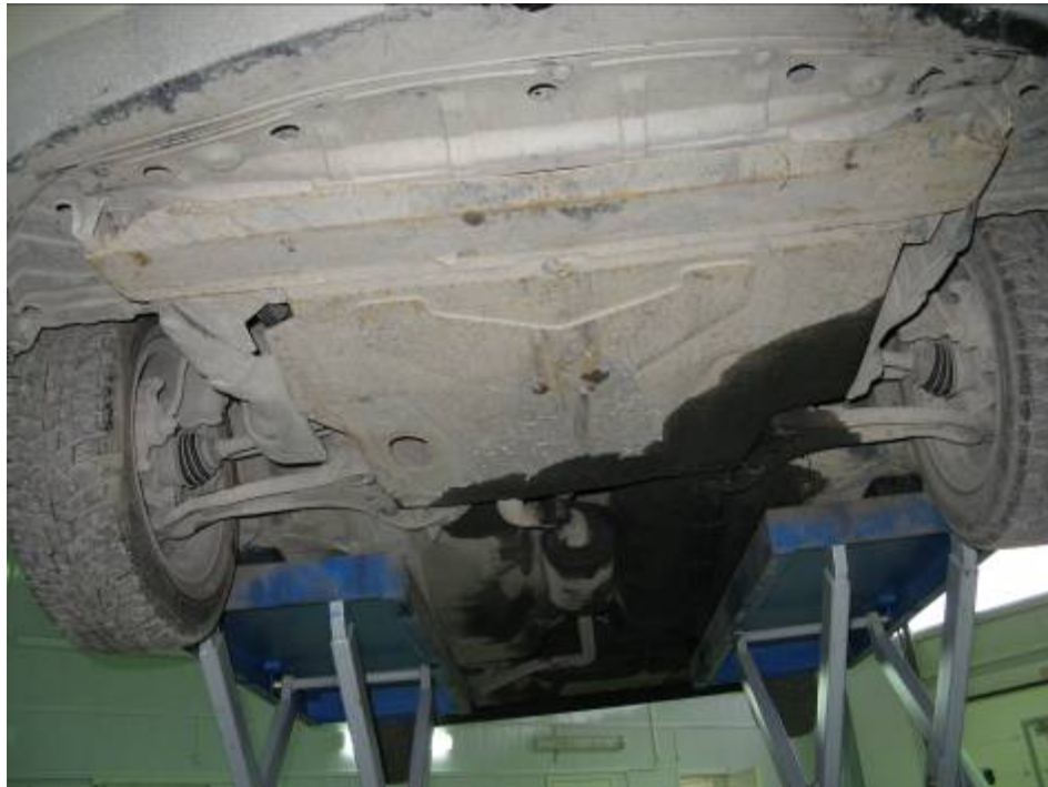
Nissan Almera C. Потечи масла на днище кузова автомобиля.