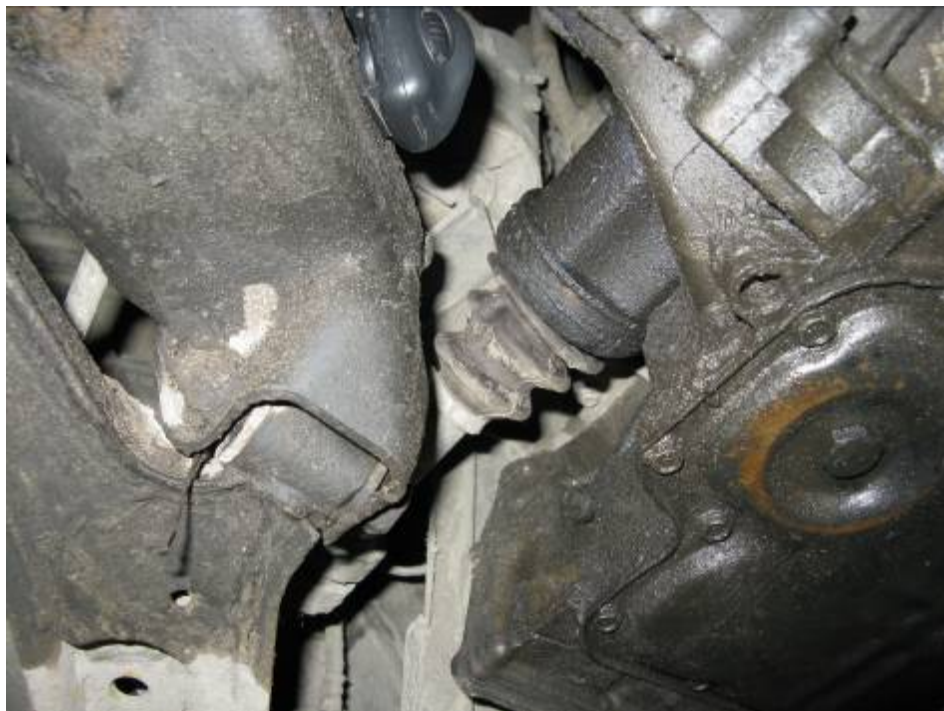
Снята защита двигателя. Подтекание масла из-под сальника привода левого колеса.