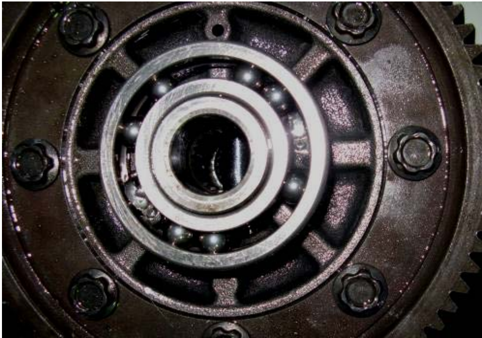
Nissan Almera C. Разрушение левого подшипника дифференциала.