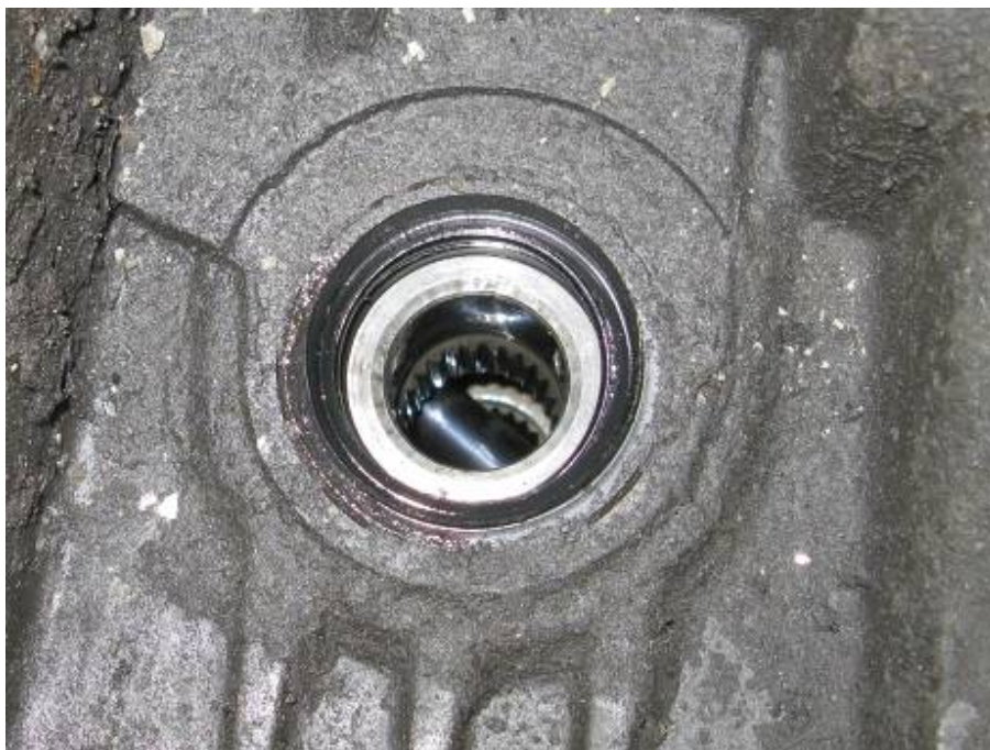
Nissan Almera C. Сальник привода левого колеса.