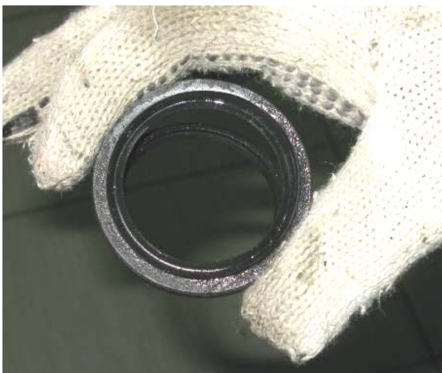
Разрушение сальника привода левого переднего колеса