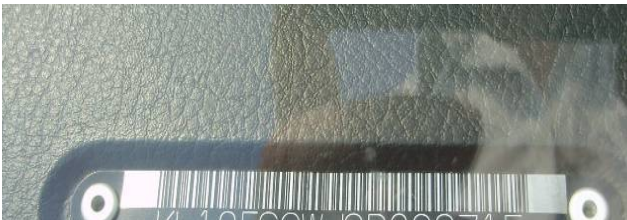
Фото 2. Идентификационный номер автомобиля, представленного на исследование.