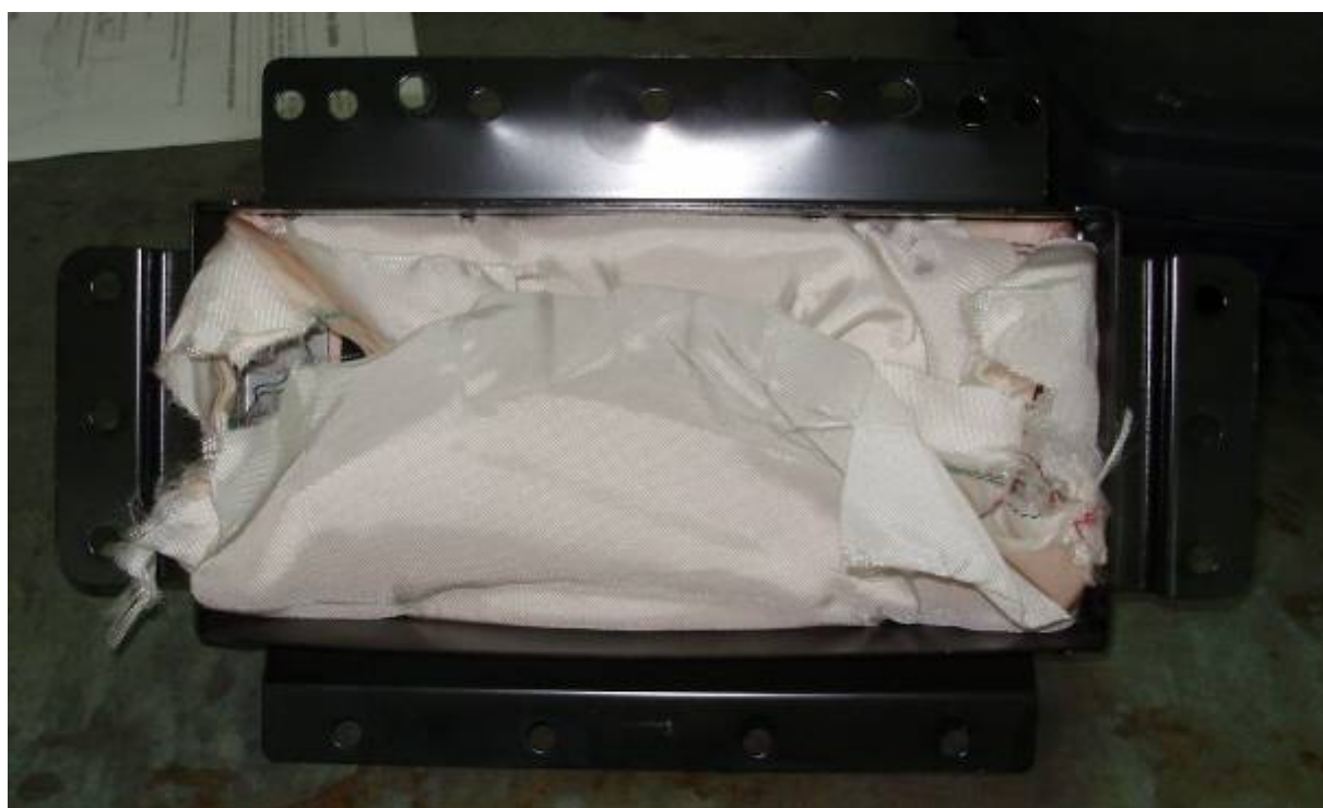
Фото 14. Оторванная часть подушки безопасности переднего пассажира, оставшаяся в модуле.