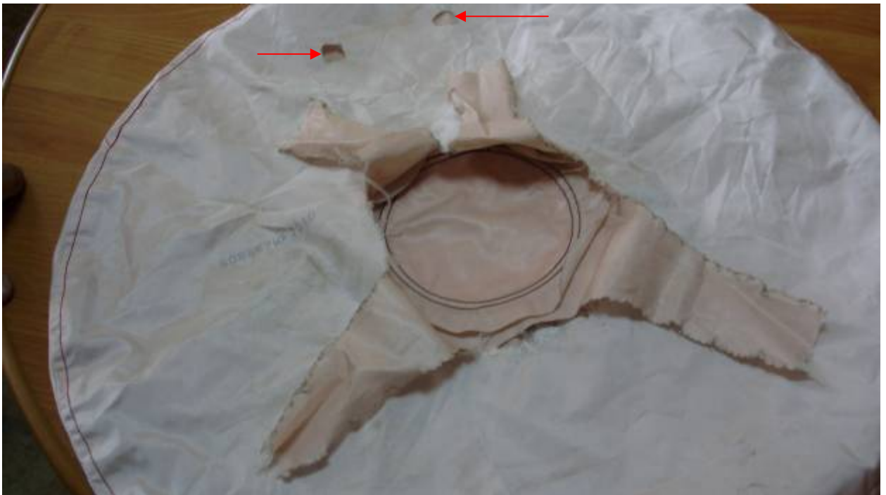
Фото 4. Общий вид подушки безопасности водителя с внутренней стороны на момент осмотра (стрелками отмечены отверстия для выхода газа.).