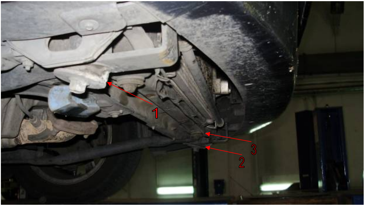
Фото 3. Повреждения передней части исследуемого автомобиля снизу.