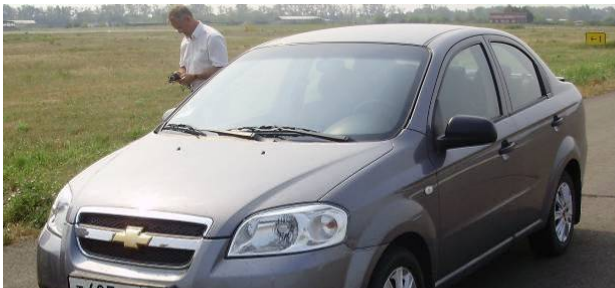
Фото 1. Общий вид автомобиля «CHEVROLET AVEO» идентификационный номер: (VIN) 0000000.