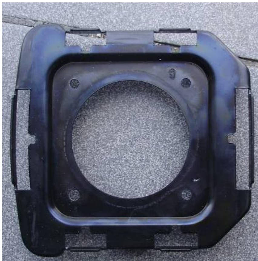
Фото 8. Общий вид внутренней поверхности пластины крепления подушки безопасности водителя.