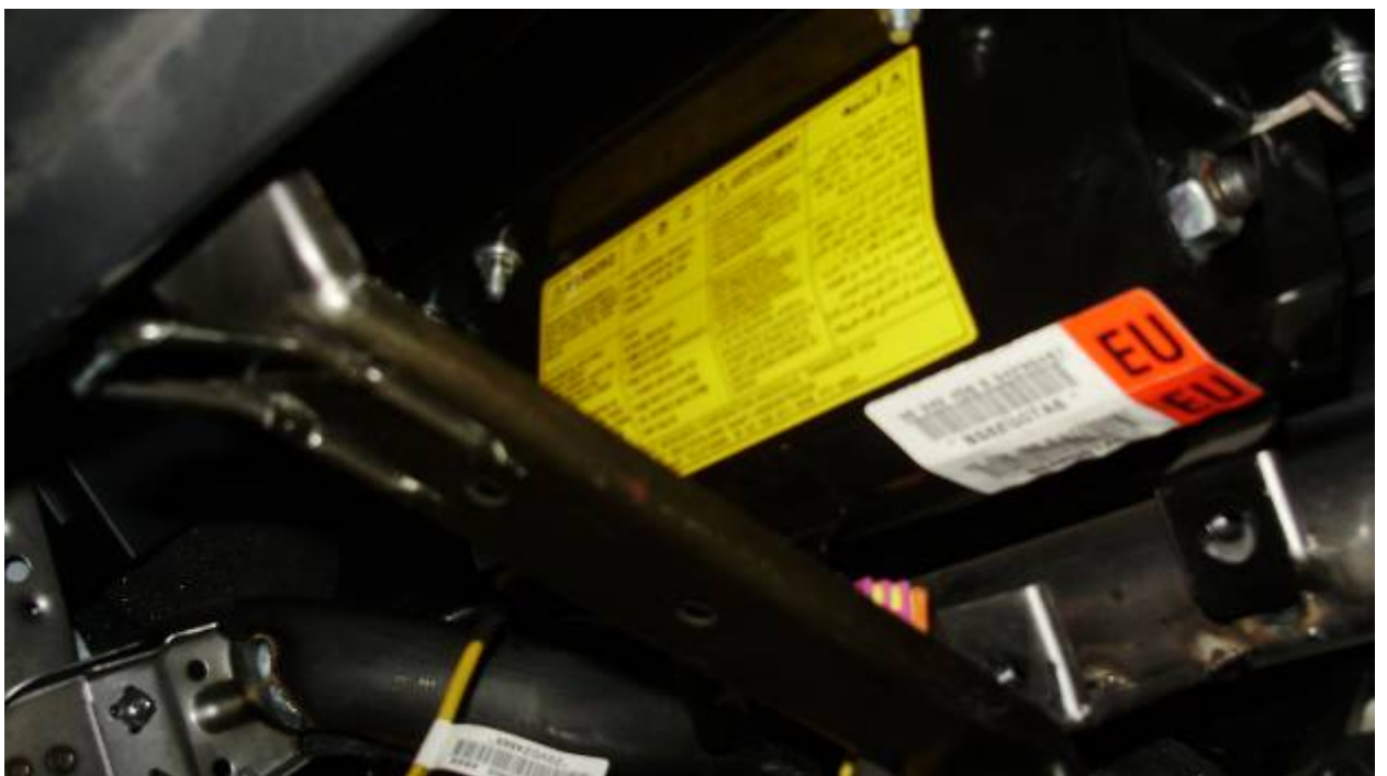
Фото 12. Модуль подушки безопасности переднего пассажира, смонтированный по штатному месту.