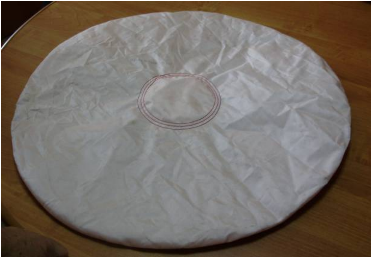
Фото 5. Общий вид подушки безопасности водителя с внешней стороны на момент осмотра.