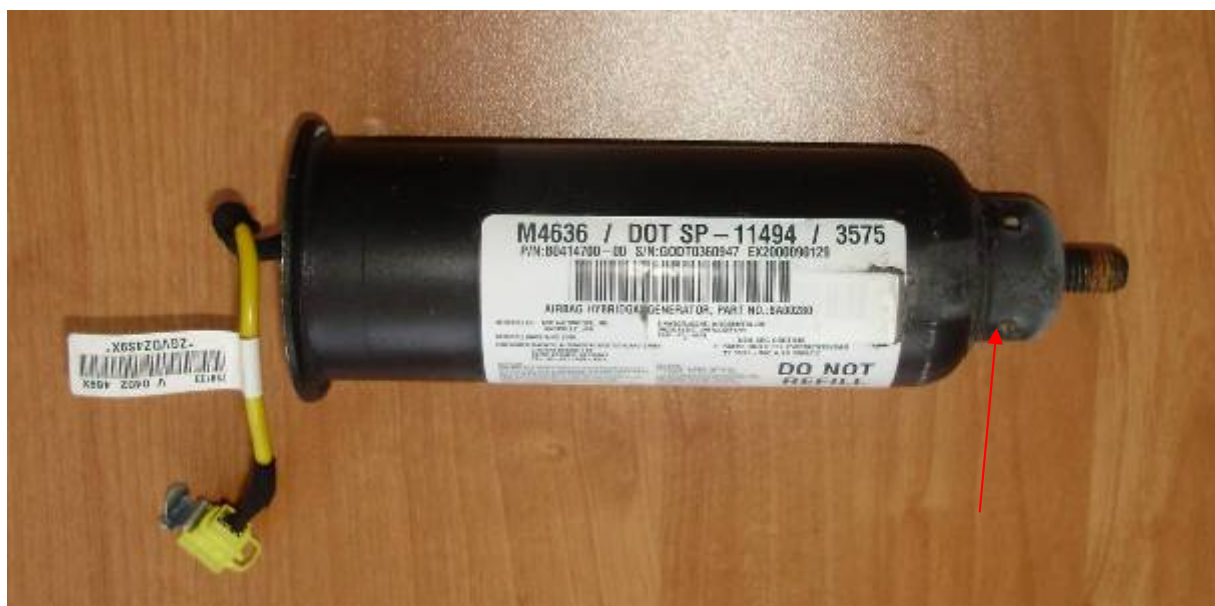
Фото 15. Газогенератор подушки безопасности переднего пассажира (стрелкой указаны следы его работы).