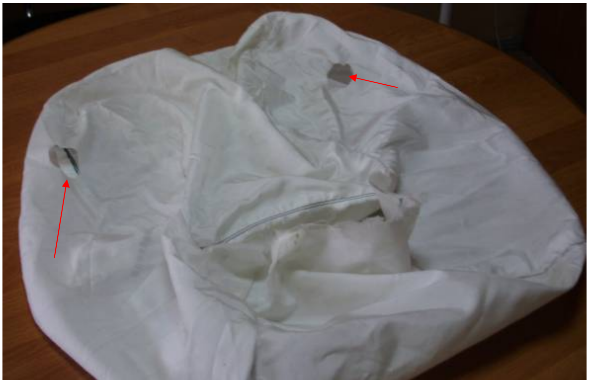
Фото 11. Общий вид подушки безопасности переднего пассажира с внутренней стороны на момент осмотра (стрелками указаны отверстия для выхода газа).