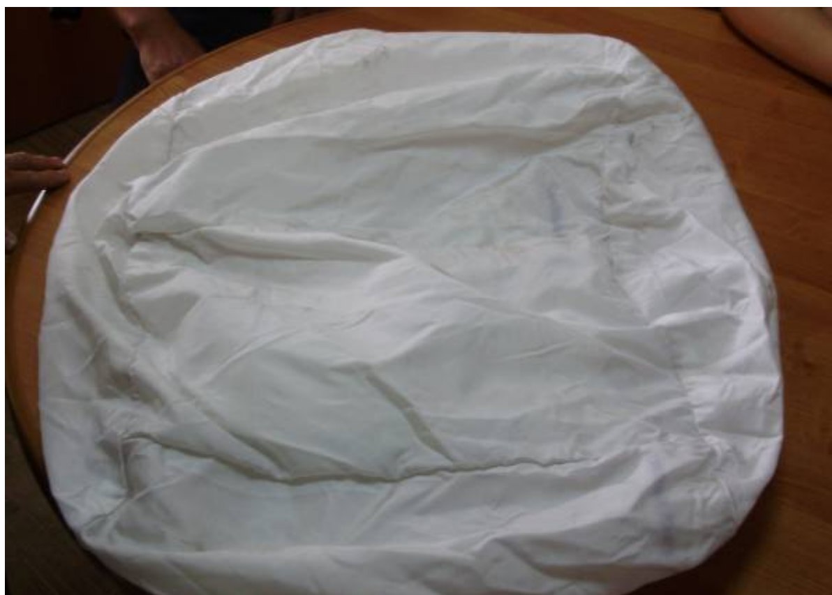
Фото 10. Общий вид подушки безопасности переднего пассажира с внешней стороны на момент осмотра.