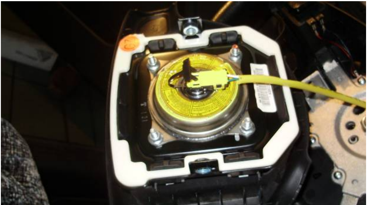
Фото 6. Модуль подушки безопасности водителя с газогенератором на момент осмотра.