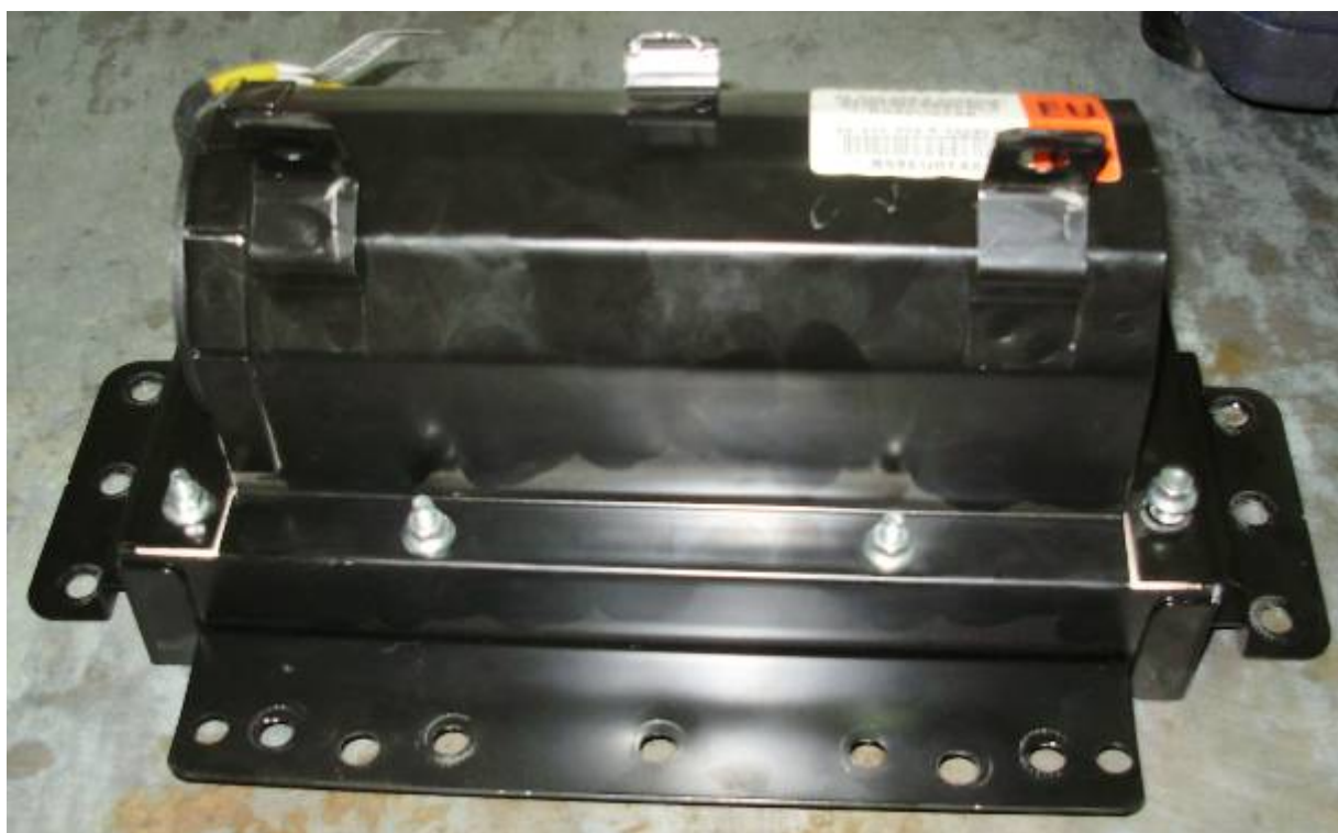
Фото 13. Общий вид демонтированного модуля подушки безопасности переднего пассажира.