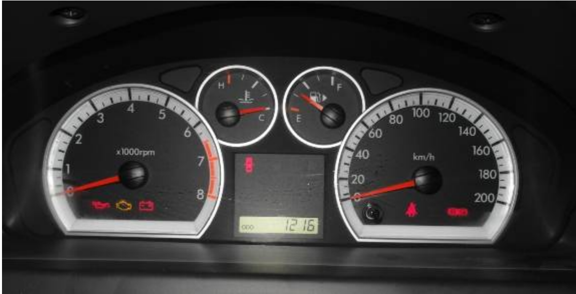
Фото 1. Пробег автомобиля на момент осмотра.