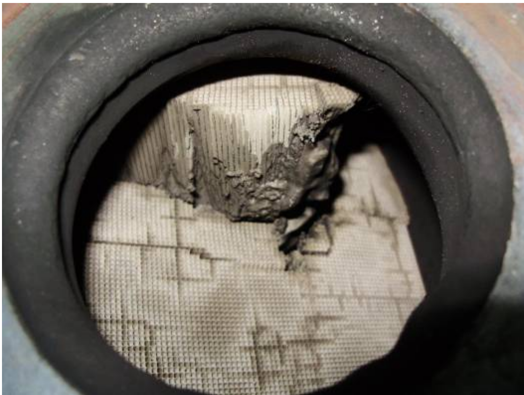
Фото 4. Разрушение сот каталитического нейтрализатора.