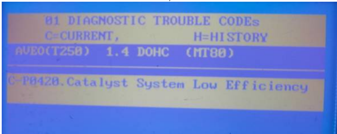
Фото 2. Ошибка, выявленная при диагностике прибором «СКАН-100».