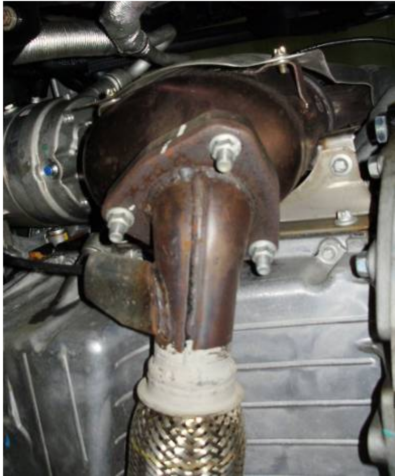
Фото 3. Общий вид каталитического нейтрализатора.