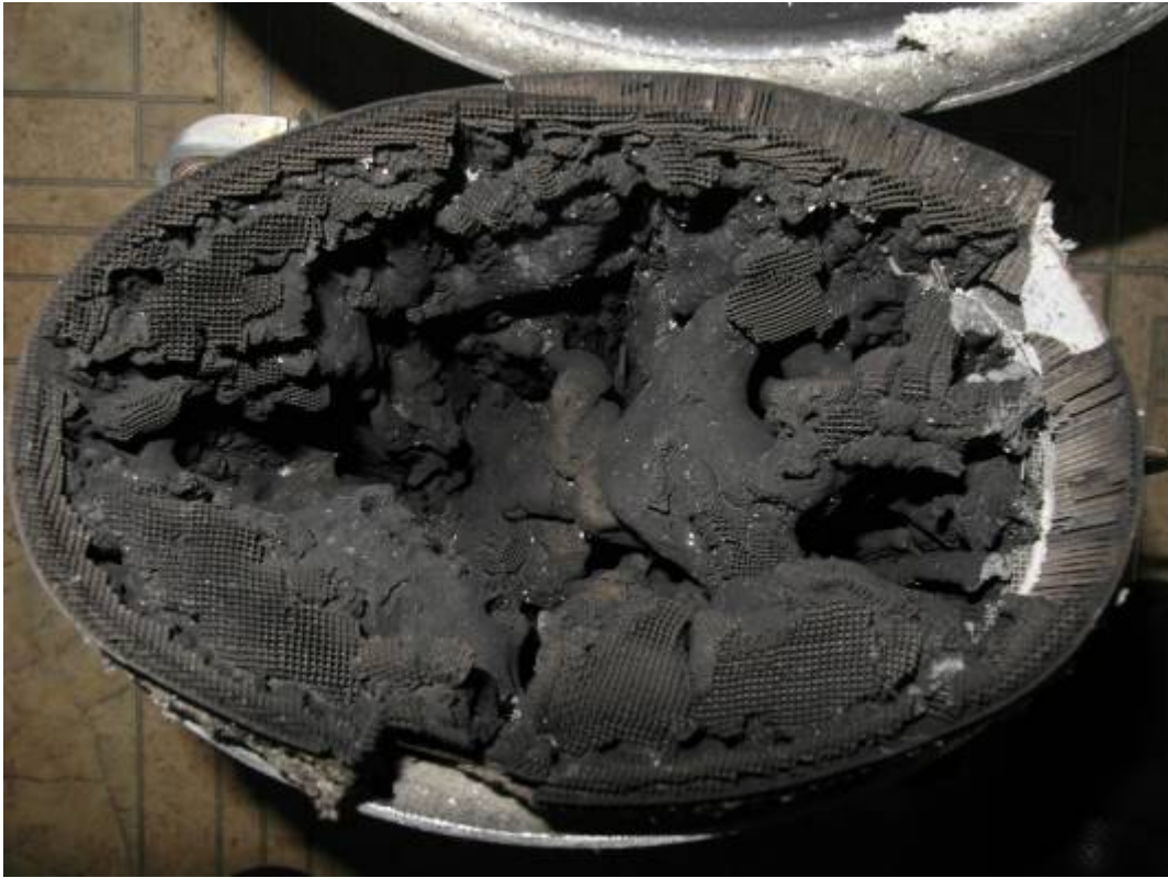
Фото 7.Оплавление сот каталитического нейтрализатора.