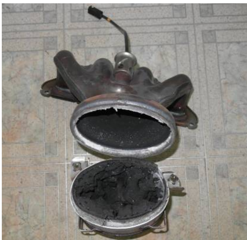
Фото 6.Общий вид каталитического нейтрализатора после вскрытия корпуса.